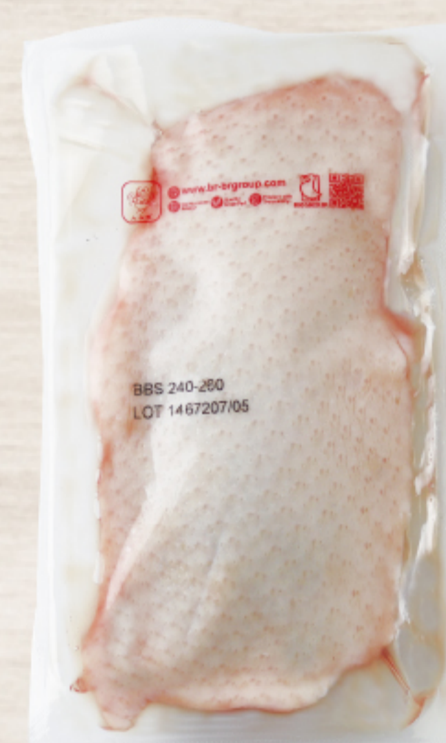
2T3G3FZ タイ産 チェリバレー種鴨骨無ムネ 200-300g