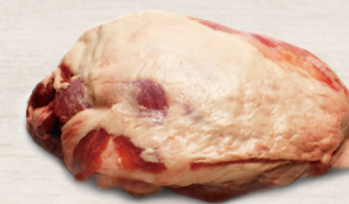
211A142 オーストラリア産 ラム ショルダー 肩ロース無し 約1.5kg

ラムの肩ロースです。適度なサシが入っており、旨味が凝縮されている部位です。ステーキ、焼き肉、ジンギスカン等、様々な用途にご利用いただけます。