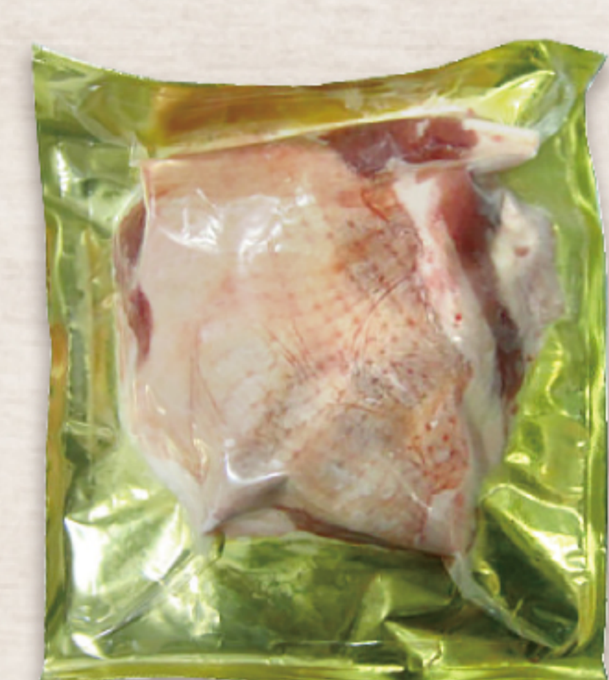
2H3G37H ハンガリー産 チェリバレー種鴨骨無モモ 150-300g (2本/パック)