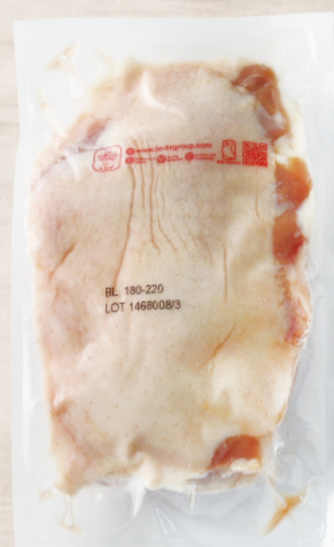
2T3G37H タイ産 チェリバレー種鴨骨無モモ 180-220g (2本/パック)