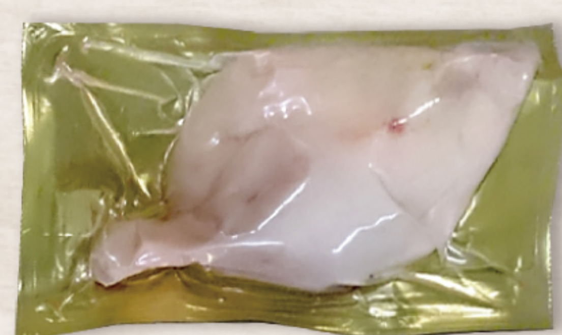
2H3G27F ハンガリー産 キュイスドカナル 250-350g