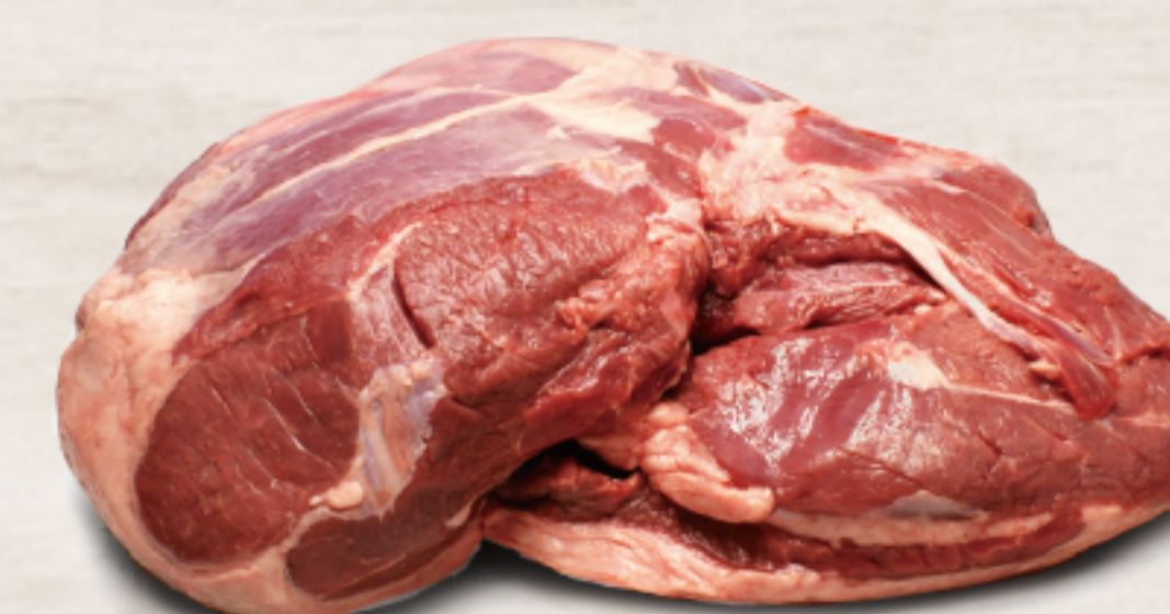
211A171 オーストラリア産 ラム ボンレスレッグ 約2.0kg

切り落としにして、ジンギスカンや焼き肉、ディスクットにして煮込みなど、幅広い用途に使用可能な部位です。