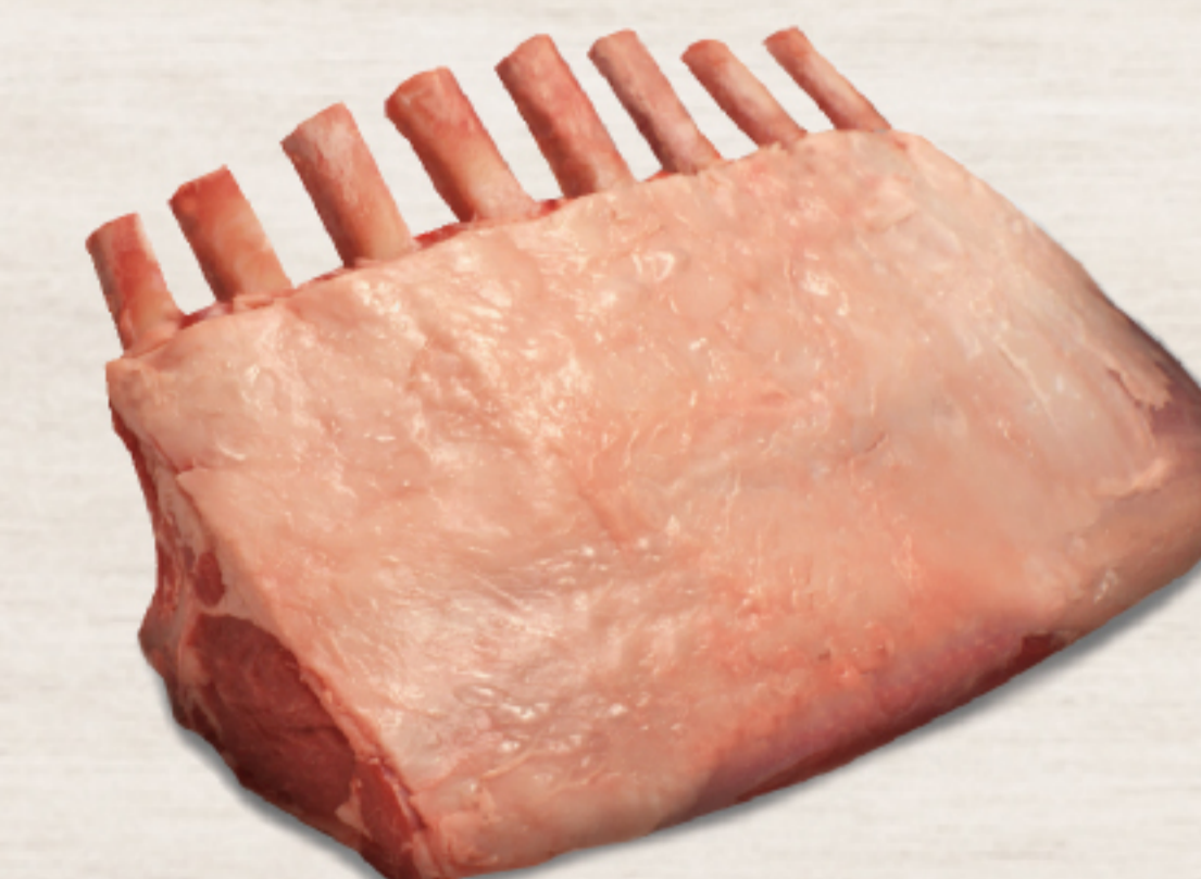
211A1AC オーストラリア産 ラム フレンチラック キャップ オフ 約600-800g

ラムの定番部位「骨付きリブローズ」です。ローストしたり、切り分けてグリルしたり、特別な日の食卓を彩る一品です。