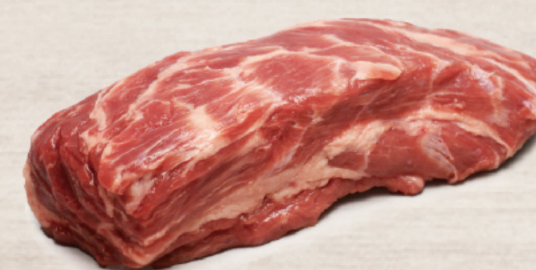
211A143 オーストラリア産 ラム チャックロール 約300-400g

ラムの定番部位「骨付きリブローズ」です。カブリが除去されているため、カットしやすい規格です。