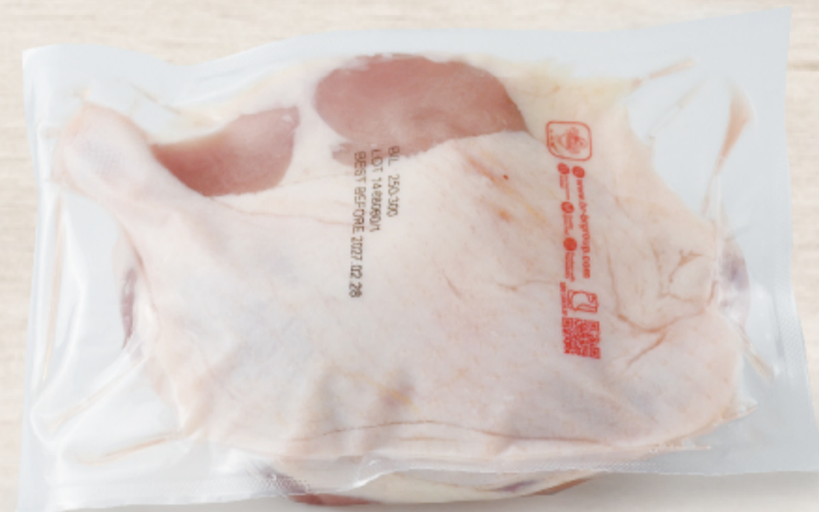
2T3G371 タイ産 チェリバレー種鴨骨付モモ 250-300g (2本/パック)