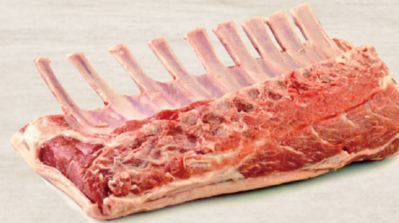
211A1A2 オーストラリア産 ラム フレンチラック 約0.8-1.0kg

生後12カ月未満の仔羊です。【共通規格】保存方法：チルド・賞味期限：製造日より70日