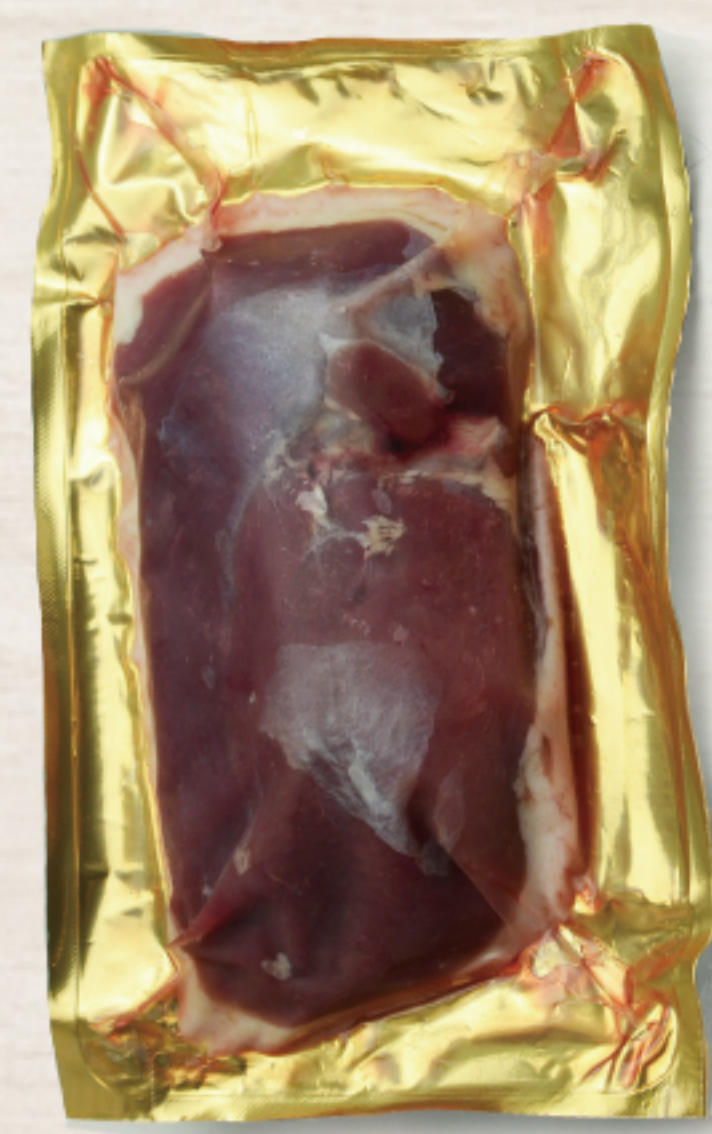
2H3G3FZ ハンガリー産 チェリバレー種鴨骨無ムネ 180-300g