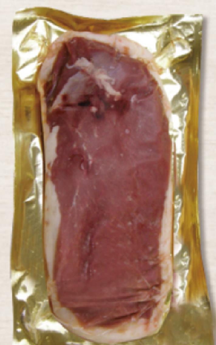
2H3G2FY ハンガリー産 マグレドカナル 300-400g