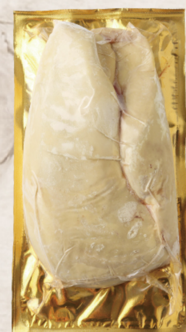
2H3G2NA ハンガリー産 フォアグラドカナル 約400-800g