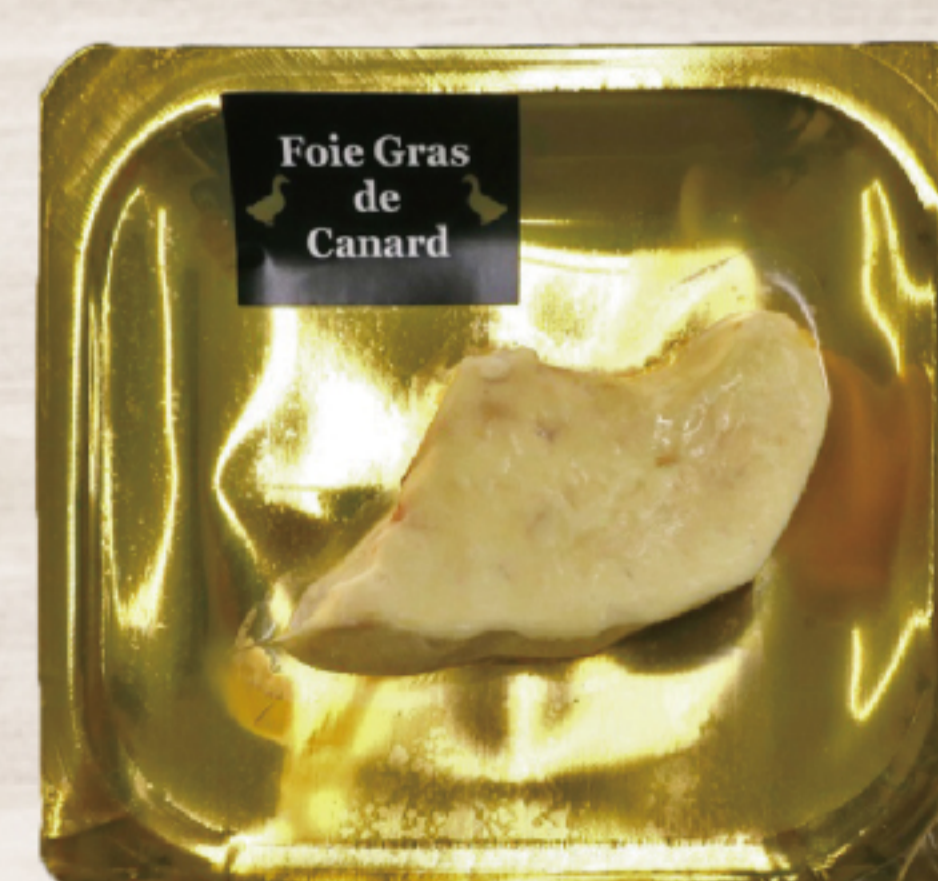
EH3G2V4 ハンガリー産 フォアグラ ポーション

ハンガリー産の鴨のフォアグラを、使い勝手の良いポーションカットにしました。見た目が鮮やかな金のパッケージなので売り場が華やかになります。