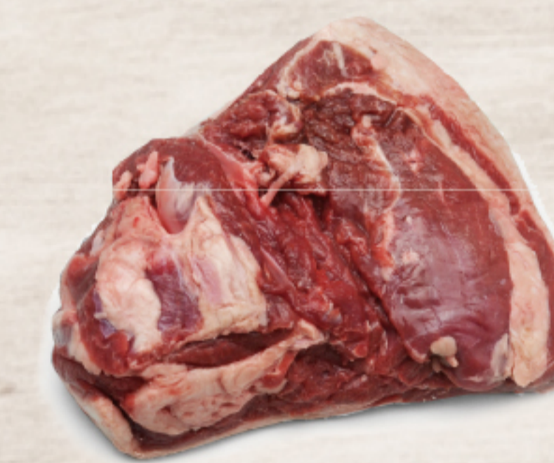
211A181 オーストラリア産 ラム チャンプアントリムド 約400-500g

カブリ付きランプです。やわらかい赤身と適度な脂があり、ラム本来の旨みをお楽しみいただけます。