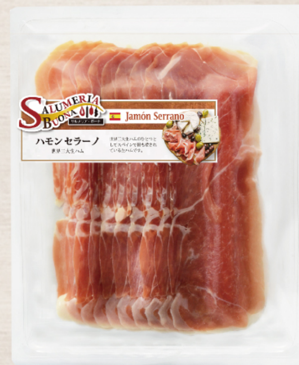
EYR2315 スペイン製 ハモンセラノ スライス 大判 100g ガスパック

熟成期間約7カ月、世界三大生ハムの一つ。ナッツのような独特の風味があり、ボリューム感のある大判のガスパックをご用意いたしました。