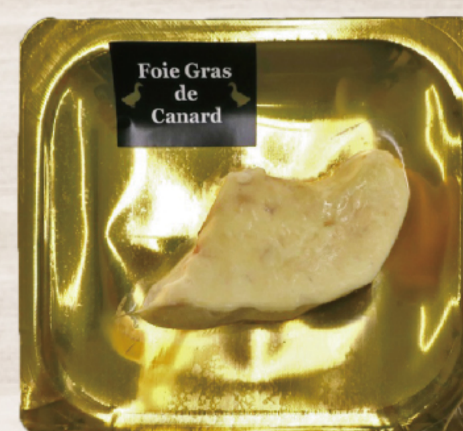
EH3G2V4 ハンガリー産 フォアグラポーション

ハンガリー産の鴨のフォアグラを、使い勝手の良いポーションカットにしました。見た目が鮮やかな金のパッケージなので売り場が華やかになります。