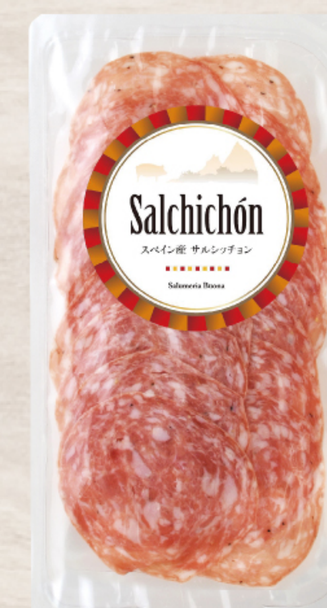
EYR4315 スペイン製 サルシッチョン スライス 50g ガスパック

スペインを代表するサラミで、スペイン産豚肉に香辛料などを加え42日以上熟成しました。少し酸味のある風味が特徴です。