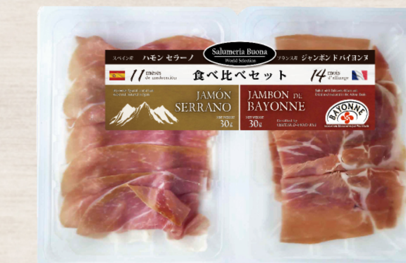
EYR2B53 フランス製 スペイン製 ジャンボン ドバイヨンヌ & ハモンセラノ 食べ比べセット 60g(30g×2) ガスパック

フランスのジャンボン ドバイヨンヌとスペインのハモンセラノの生ハム食べ比べセットです。オードブルに最適なハーフサイズカットです。