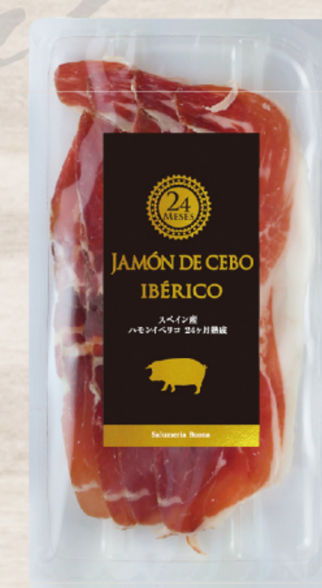
EYR2512 スペイン製 ハモンイベリコ スライス 30g ガスパック

イベリア半島の在来種であるイベリコ豚のもも肉を24カ月熟成させました。長期熟成ならではの深みのある複雑な風味をお楽しみください。