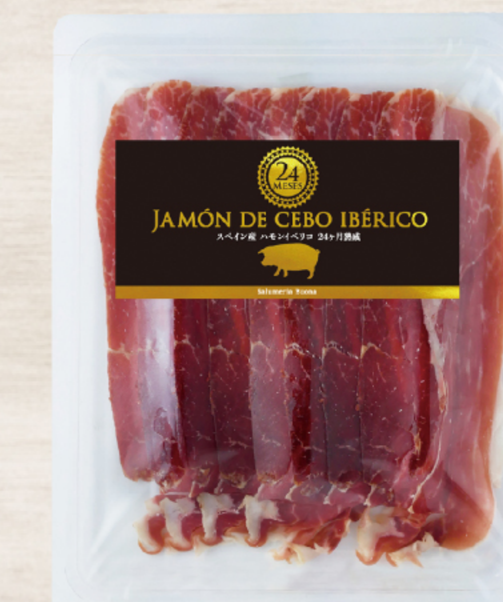
EYR2515 スペイン製 ハモンイベリコ スライス 60g ガスパック

赤身、脂の旨みの強いイベリコ豚を24カ月間熟成させることにより、複雑な香りと、しっかりとした肉、脂の旨みをお楽しみいただけます。