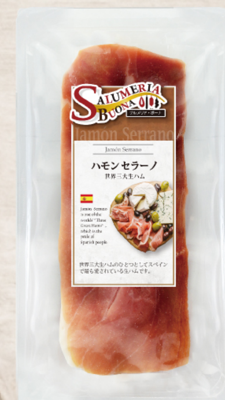
EYR2311 スペイン製 ハモンセラノ スライス 50g ガスパック

世界三大生ハムの1つと言われるハモンセラノは生ハム大国スペインで最もよく食べられています。ナッツのような風味のある、しっかりした赤身のうまみが特徴です。