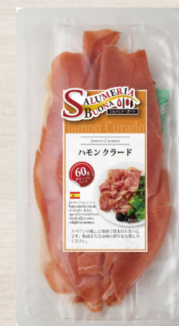
EYR231C スペイン製 ハモンクラード スライス 60g ガスパック

生ハムの本場であるスペインでしっかりと熟成された生ハムです。「ハモン」はハム、「クラード」は熟成という意味です。赤身のしっかりとした旨みと熟成による深みのある香りが特徴です。