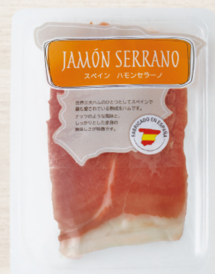
EYR2310 スペイン製 ハモンセラノ スライス 25g ガスパック

世界三大生ハムの1つと言われるスペイン産ハモンセラノです。お買い求めやすいミニパックをご用意しました。