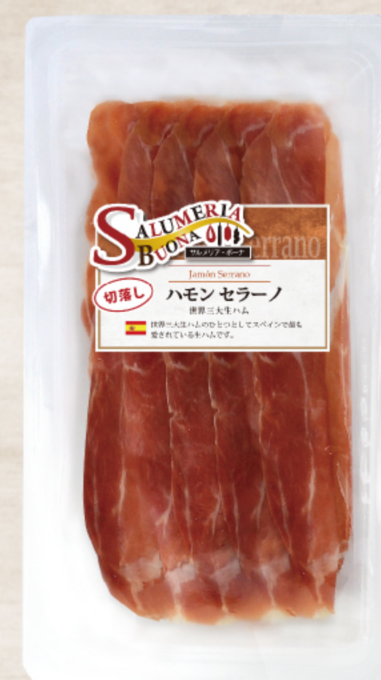
EYR2318 スペイン製 ハモンセラノ切落し 120g ガスパック

熟成期間約7カ月、世界三大生ハムの一つでナッツのような独特の風味があります。切落しタイプでお得感のある商品です。