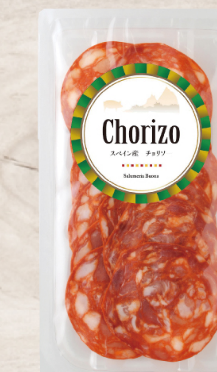
EYR43A5 スペイン製 チョリソー スライス 50g ガスパック

スペイン産豚肉に香辛料などを加え、42日以上熟成したサラミです。赤い色はパプリカ由来ですので辛味はなく、マイルドな口当たりです。