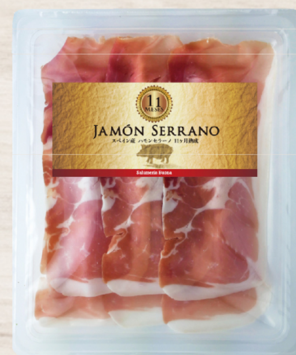
EYR2312 スペイン製 11 カ月熟成 ハモンセラノ スライス 60g ガスパック

発色剤、酸化防止剤を使用していないスペイン製のハモンセラノです。熟成期間も11カ月と長いため芳醇な風味をお楽しみいただけます。